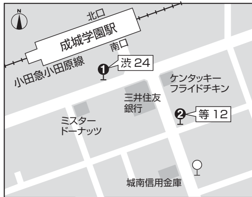
成城学園前駅 バス乗り場 (乗車時間 15分)