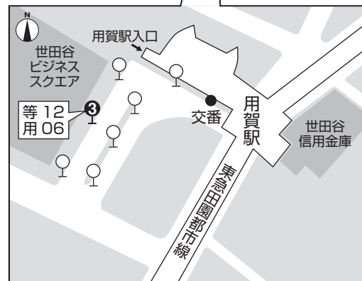
用賀駅 バス乗り場 (乗車時間 25分)