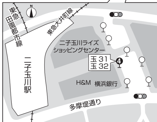
二子玉川駅 バス乗り場 (乗車時間 40分)